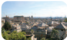
Panorama da Castelletto

Anticamente, attraverso varchi nella cinta muraria, si accedeva alla città fortificata: uno di questi è Porta dei Vacca, che oggi ti consente di entrare nel cuore del centro storico. La porta, che domina l'inizio di via del Campo, venne costruita nel 1155 come difesa della città contro le minacce esterne. Risalendo lungo via delle Fontane si